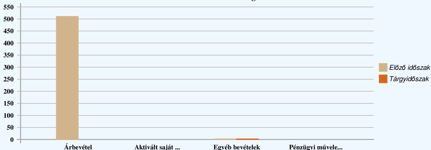
Bevételek alakulása és megoszlása